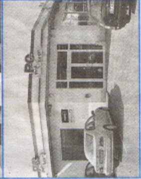
Unten: Ein starkes Team!